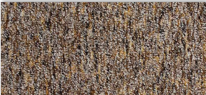
44 2m + 3m + 4m + 5m

La société Associated Weavers se réserve le droit de modifier les caractéristiques de ce produit tout en conservant les mêmes qualités techniques. Il est fortement conseillé d'utiliser les coloris moyens et foncés pour les pièces à grand trafic.