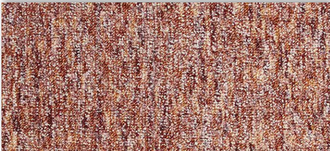
84 2m + 3m + 4m + 5m