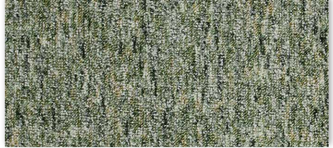
29 2m + 3m + 4m + 5m