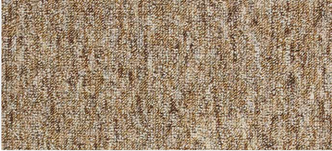
33 2m + 3m + 4m + 5m