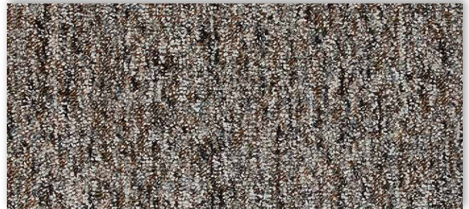
49 2m + 3m + 4m + 5m