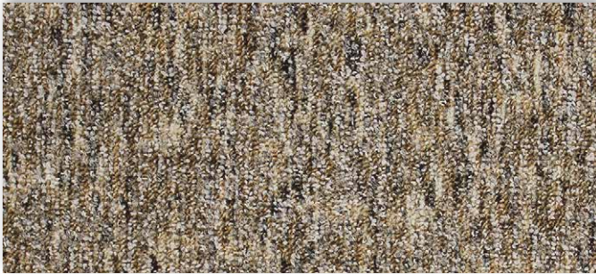
39 2m + 3m + 4m + 5m